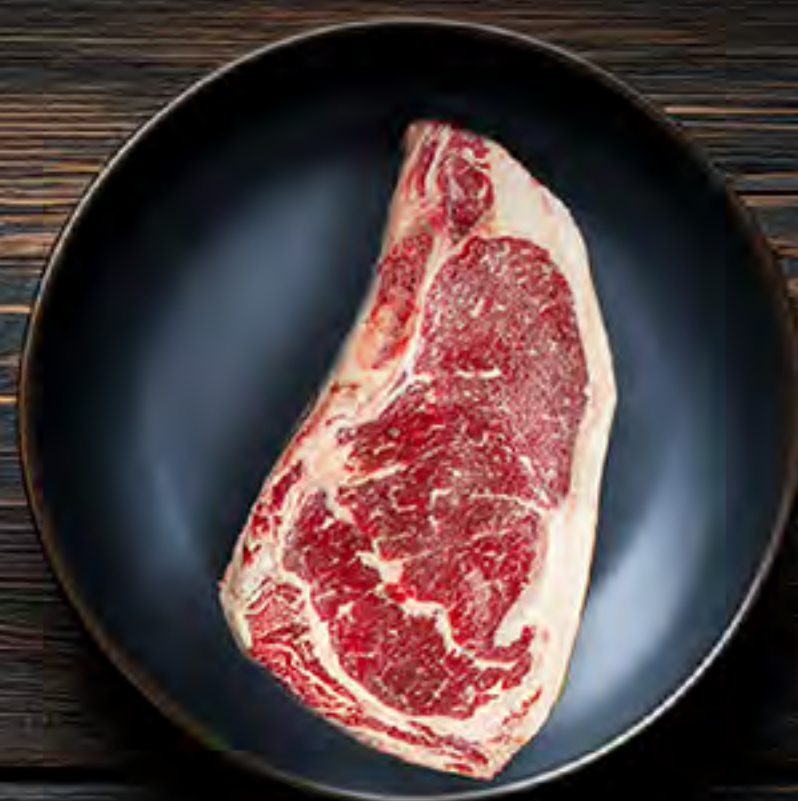
New York Nicaragua Previamente Congelado $8.19 lb