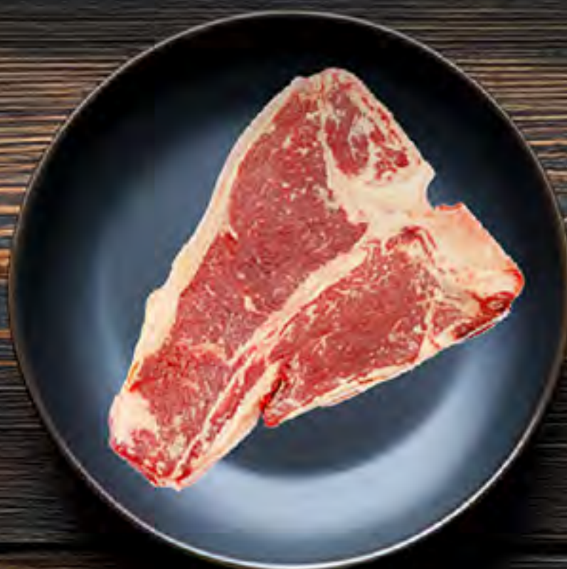
T-Bone Steak Nicaragua Previamente Congelado $7.25 lb