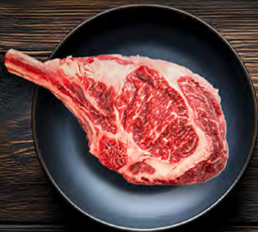
Tomahawk Nicaragua Previamente Congelado $9.99 lb